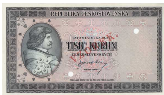
bankovní vzor 1000 Kč (1945)

V dalších zemích jsou pro označení bankovních vzorů používány názvy v místním jazyce (např. německy MUSTER, anglicky CANCELLED). Nominály určené jako bankovní vzor mohou být ještě opatřeny další perforací, např. otvory o průměru několika mm až cm.