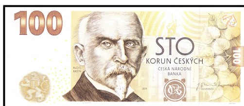
pamětní 100 Kč 2019, avers

Bankovka vydaná v upomínku určité významné politické události či osobnosti, výročí, mimořádného přírodního úkazu. Např. ve Švédsku 50 K / 1948 k 90. narozeninám krále Gustava V., 10 K / 1968 ke 300. výročí švédské Riksbanky a 100 K / 2005 k 250. výročí zahájení výroby bankovkového papíru v Tumbě Bruku, v Bulharsku 20 leva / 2005 ke 120. výročí emise první bulharské bankovky, v Rumunsku 2000 lei / 1999 k přírodnímu úkazu úplného zatmění slunce pozorovatelného v Rumunsku a 100 lei / 2018 ke 100. výročí sjednocení země, v České republice 100 Kč / 2019 ke 100. výročí československé měny.