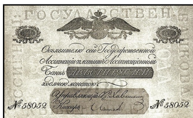
Rusko 200 Rb 1830