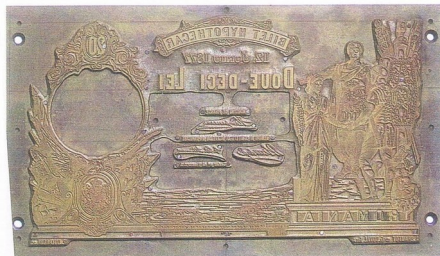
měděný štoček pro tisk 20 lei 1877, Rumunsko

Druh tiskařské formy z různého materiálu, jako je dřevo, kámen, kov, litá písmovina, umělá hmota. Do této formy se vyryje, případně chemicky vyleptá či laserem vypálí negativní obrazec platidla, který se po nanesení barvy otiskne na bankovkový papír. Pro vícebarevné platidlo se na každou barvu používá zvláštní štoček s odpovídajícím obrazcem, tj. částí kompletního obrazu.