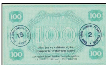
poukázka v hodnotě 100 (bez uvedení měnové jednotky)

Poukázky vydávané jednotlivými vězeňskými zařízeními, za něž si vězni mohou kupovat určité druhy zboží přímo v prodejně příslušného vězeňského zařízení. Platí jen ve vnitřním styku v nápravně výchovném ústavu. Hodnota poukázek pro každého vězně je částí celkového příjmu vězně z jeho pracovní činnosti. Na poukázkách bývá otisk razítka příslušného zařízení.