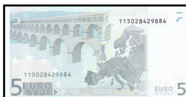
revers, vpravo nahoře