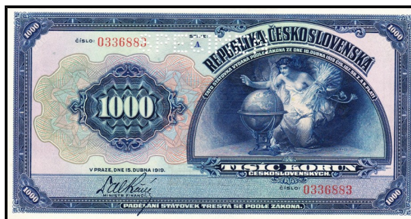
státovka 1000 Kč 1919 - SPECIMEN

Papírové platidlo vydávané státní institucí, obvykle ministerstvem financí na základě legislativního pověření. Např. v Československé republice byly po roce 1918 prvními dvěma emisemi papírových platidel výhradně státovky, jejichž emitentem byl Bankovní úřad ministerstva financí. Později byly vydávány jako státovky nominály nižších hodnot, zatímco vyššími hodnotami byly bankovky. Posledními papírovými státovkami vydanými na našem území byly 3 Kčs a 5 Kčs z roku 1961. Zatímco bankovky nesly název centrální banky, státovky nesly buď označení emitenta – ministerstvo financí anebo přímo označení „státovka Československé republiky“.