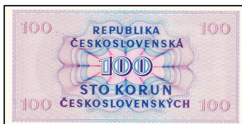
giloš po celé ploše tiskového obrazce

Jemné až vlasové geometrické, elipsovité, kruhovitě linie do sebe uzavřené nebo se dále rozvíjející nebo průběžné geometrické vzory dekorativní povahy na bankovkách, cenných papírech, kolcích a některých dokumentech jako ochrana proti padělání. Tiskne se z kovové desky, na které se prvek vytváří strojovým rytím, v současnosti spíše procesem řízeným počítačem zanechávajícím trvalou stopu, případně tzv. irizující efekt. Gilošové prvky v různé míře doplňují autorský výtvarný návrh.