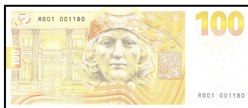
pamětní 100 Kč 2019, revers