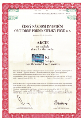
akcie ČNIOPF Litoměřice

Směnky, akcie, podílové listy, dluhopisy, hypoteční (zástavní) listy, šeky, deriváty, při jejichž výrobě jsou využívány různé ochranné prvky cedulových produktů.