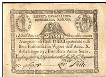
Římská republika 10 paoli 1798