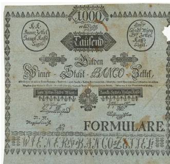
vzor bankocedule 1000 gulden z listopadu 1784

Původně Banko-Zettel – viz označení rakouských platidel z 18. a počátku 19. století – počestěno v lidové mluvě na „bankocetle“, kterýžto pojem byl v odborných kruzích později změněn na spisovnější „bankocedule“. Odtud i termín „cedulová banka“ – viz.