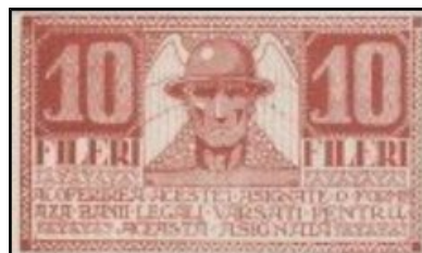
Rumunsko, město Timișoara 10 fileri 1919