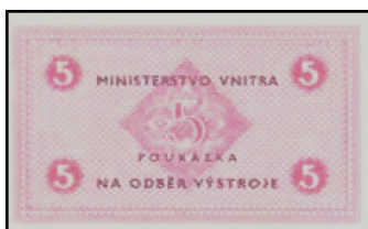
výstrojová poukázka v hodnotě 5 (bez uvedení měnové jednotky)

Poukázky na odběr výstroje bezpečnostního aparátu a vězeňské služby, vnitřní účelové platidlo ministerstva vnitra. V průběhu let existovala různá škála nominálů. Od roku 1973 emitentem poukázek ve vězeňské sféře Správa sboru nápravné výchovy ČSR, na Slovensku Zbor nápravnej výchovy SSR. Tyto emise již měly série, čísla a ochranné prvky jako „oficiální“ oběživo.