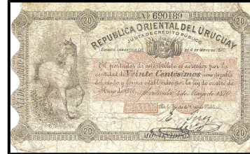
Uruguay, 20 centesimos 1870