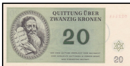
Terezínská poukázka 20 K

Papírová platidla používaná ve vojenských, zajateckých, pracovních a koncentračních táborech. Pro každý takový tábor byla tištěna speciální platidla, jejichž platnost byla omezena na prostor samotného tábora. Řadí se sem i známé poukázky z terezínského židovského gheta. V případě např. zajateckých táborů z konce 1. světové války existují též univerzální tvary platidel, na která se dotiskovaly konkrétní táborové lokality.