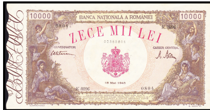
Rumunsko, 10 000 lei 1945

Nepotištěný zpravidla levý okraj papírového platidla nebo cenného papíru, který nese další ochranné prvky někdy doplněné vlnovkovým ořezem. Ten byl použit například na argentinských a uruguajských bankovkách okolo roku 1870 nebo na rumunských bankovkách z let 1945 - 1947.