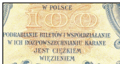
trestní pohružka (těžkým vězením) na 100 zlotých 28. 2.1919