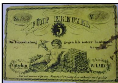
5 krejcarů 1849, emitent W. Lahn, Jičín

Platidlo vydávané zvláště v ekonomicky nejistých dobách (např. po válce) při nedostatku oficiálního oběživa (např. v důsledku teaurace drobných mincí) zvláště obcemi, majiteli obchodů, firmami, ale i nepriviligovanými finančními institucemi. Běžně byly tištěny na papíře, někde – zvláště v době poválečné hyperinflatione po 1. světové válce v Německu - ale také na kůži (Osterwieck am Harz, 1922 – 1923), na plátně, hedvábí či jutě (Bielefeld 1921 -1923, Pössneck 1923) a dokonce na překližce. U nás byla nouzová platidla hojně vydávaná ve městech a obcích v letech 1848 – 1850.