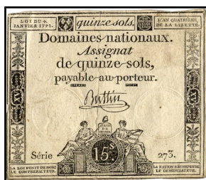
Francie 15 sols

4. Nouzová platidla, která v hodnotách 10, 20 a 50 fileri vydalo v roce 1919 město Timișoara v Rumunsku (asignat).