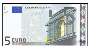
avers, vlevo nahoře

Ochranný prvek, který vzniká tak, že na jedné straně bankovky je viditelná pouze jedna část obrazce, z druhé strany zbývající a při současném tisku obou stran bankovky je zabezpečen dokonalý soutisk obou částí obrazce. Celý obrazec je pak viditelný v průhledu proti světlu a jeho jednotlivé linky na sebe přesně navazují – viz Ochranné prvky.