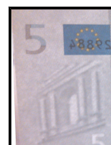
proti světlu viditelný soutisk 5, pod ním vodoznak