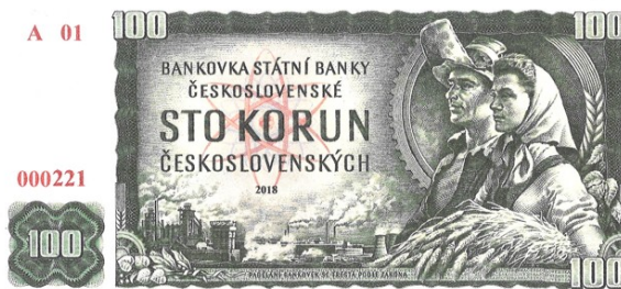
komerční novotisk z roku 2018

Žertovné bankovky (anglicky funny banknotes) jsou časté a oblíbené zvláště v anglofonních zemích, tedy ve Velké Británii, USA a Austrálii. Jsou to pozměněné bankovky, často „politicky nekorektně“ karikující královnu, prezidenty či jiné osobnosti. Oficiální portrét Alžběty II. je pozměněn tak, že zobrazuje panovnici např. pojíždající popcorn nebo obdařenou knírkem a čepicí nebo v objetí komiksově postavičky; na dolarových bankovkách lze spatřit místo portrétů ctihodných postav z americké historie třeba Billa Clintona s doutníkem nebo Elvise Presleyho, atd.