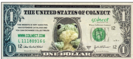
reklama Colnect s využitím 1 USD, avers