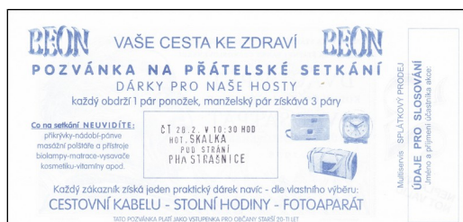
revers s reklamní pozvánkou