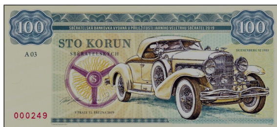
ze Zapadlíkovy série automobilových veteránů

„ Sběratelské bankovky “ je značně zavádějící pojem pro označení svého druhu reklamních bankovek, komerčních artefaktů, jejichž jediným cílem a smyslem je zisk z jejich prodeje. Sugestivním označením se má vyvolat dojem nezbytnosti pro sběratele.