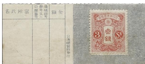
zde hodnota 3 sen

Na Tchajwanu byly v roce 1920 jako náhrada za mince dány do oběhu japonské poštovní známky nalepené na speciálním podkladu v hodnotách 1, 3, 10 a 20 sen: