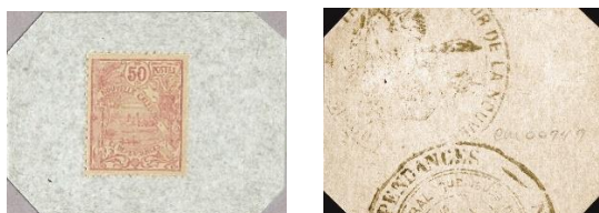
50 centimů, avers a revers