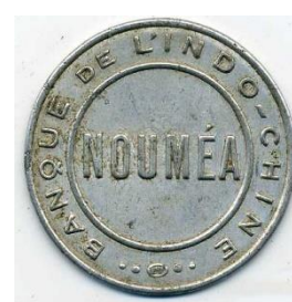
50 centimů, avers a revers

Tento článek samozřejmě nemůže postihnout celou světovou produkci poštovních známek upravených k účelům peněžního oběhu. Autor jej předkládá sběratelům papírových platidel k posouzení a k zamyšlení nad specifickou kombinací propojující filatelii s notafilii a numismatikou obecně.