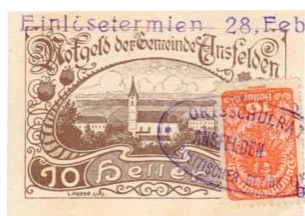
ukázka 2. typu