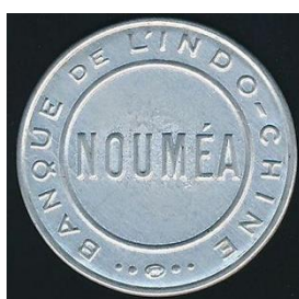
25 centimů, avers a revers