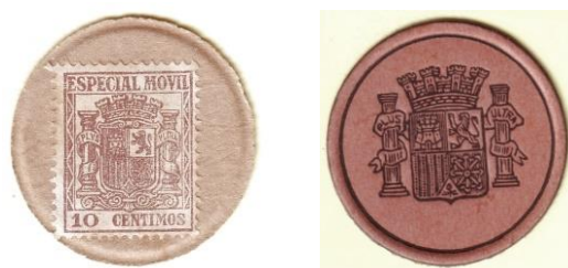
avers a revers

Pokud jde o Německo , Pick uvádí celkem 60 lokalit, v nichž různé firmy vydávaly platidla buď s použitím skutečných poštovních známek nebo v podobě jejich výtisků na speciální podklad. A u Francie je známo několik emisí s papírovým podkladem a velké množství kapslových. U dalších evropských zemí se vyskytují různé.