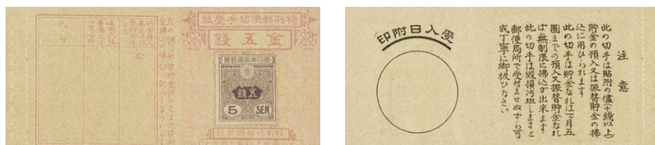
Korea 5 sen 1917

Ačkoliv by se mohlo zdát, že následující exemplář patří do tchajwanské emise, jde o platidlo v hodnotě 5 sen, vydané v roce 1917 pro Koreu :