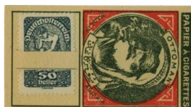
ukázka 3. typu