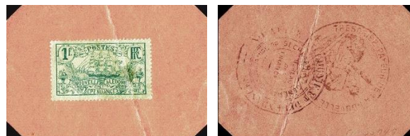
1 frank, avers a revers

V roce 1922 stejná banka vydala emisi poštovních známek vlepených do kapslí: