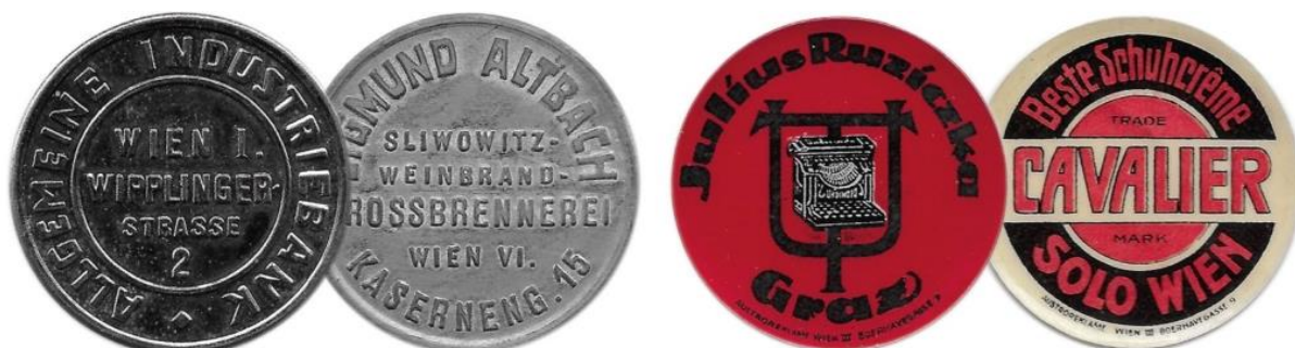
ukázky rubových stran kovových a plastových kapslí určených k umístění reklamy

Velkou oblibu emitentů si získal 4. typ, který imitoval vzhled mincí a skýtal příležitost pro reklamu jejich výrobků. Bylo zjištěno, že každá taková kapsle změny nejméně třikrát denně majitele.