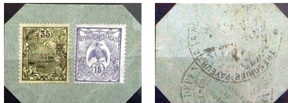
50 centimů, avers a revers