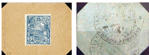
25 centimů, avers a revers

V letech 1914-1923 vydávala Banque de l'Indo-Chine / Indočínská banka poštovní známky nalepené na kartonu jako oběhové platidlo, a to v hodnotách 25, 50 centimů a 1 frank, přičemž 50 centimů měla dvě podoby – na jedné byly známky 35 + 15 centimů, na druhé 50centimová známka.