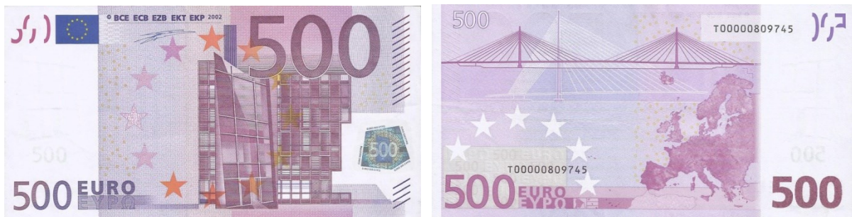
Evropská unie, 500 euro 2022, i když platná, do oběhu se už nevydává

Před několika lety jsme se setkali s tím, že centrální banky přestaly dávat do oběhu bankovky vysokých nominálních hodnot, například 500eurové bankovky.